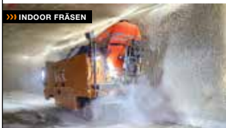
»»» INDOOR FRÄSEN